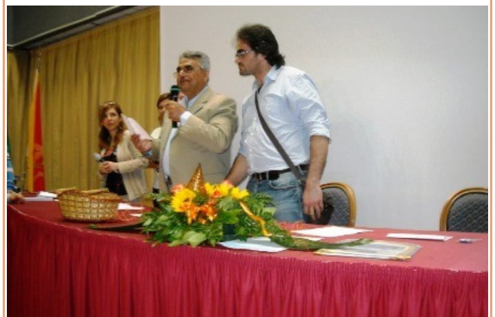
Il Presidente proclama i vincitori