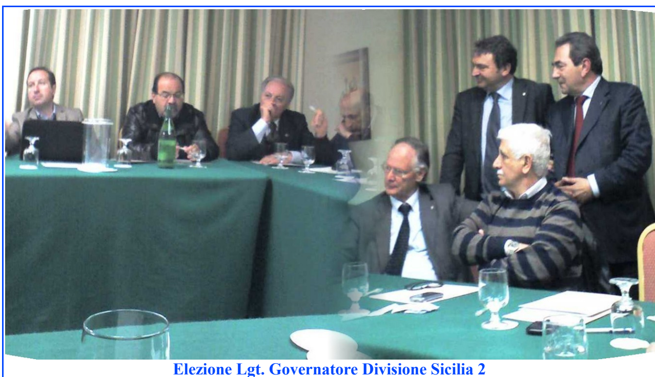
Elezione Lgt. Governatore Divisione Sicilia 2