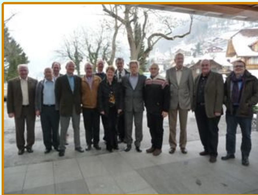
I partecipanti del workshop posano per la foto di gruppo