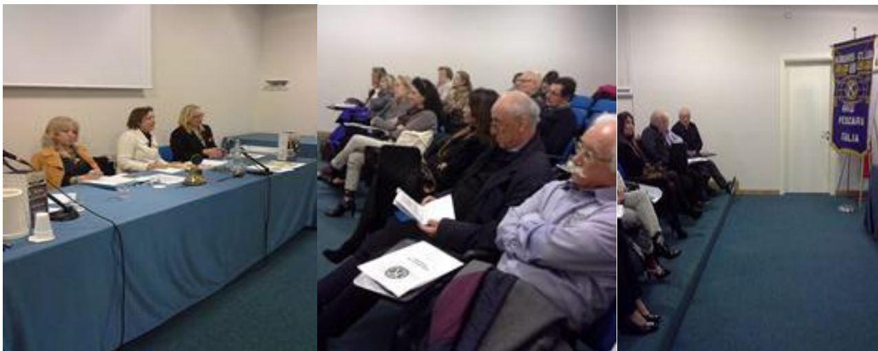
Tavolo Presidenza e partecipanti

maggio. L'Assemblea si è conclusa con una simpaticissima conviviale.