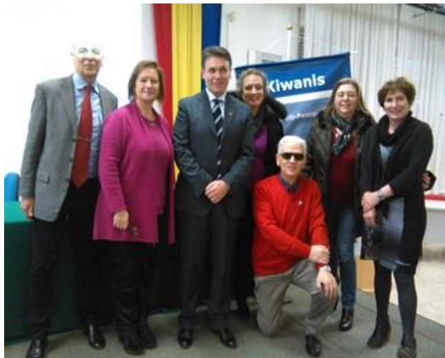
Foto di gruppo