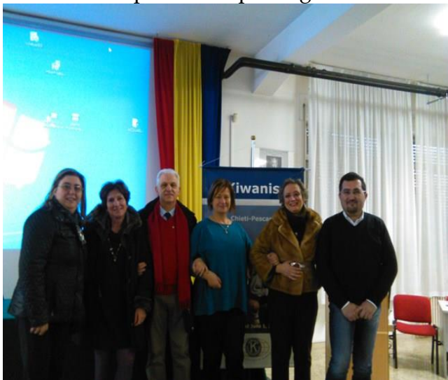
Insegnanti, Dir.Scolastico, Pres.Eletto, Presidente e Relatore

Il Dirigente scolastico ed il corpo docente si sono congratulati per la preziosa e competente informazione medico-scientifica prestata, esprimendo profonda gratitudine al club Chieti-Pescara e auspicando il prosieguo della collaborazione con nuove iniziative formative.