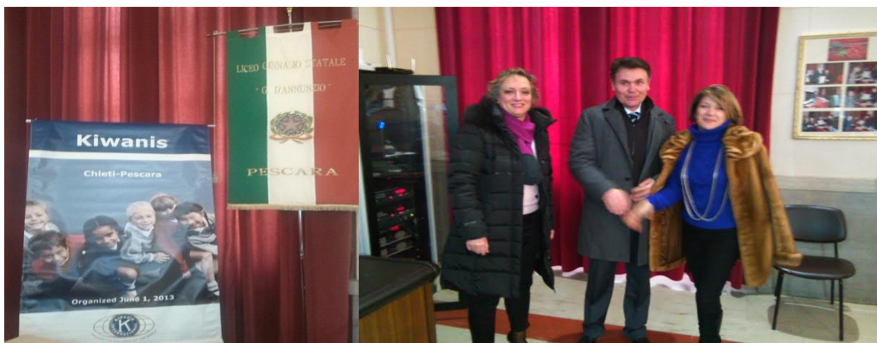
Banner del KC Chieti-Pescara e della scuola