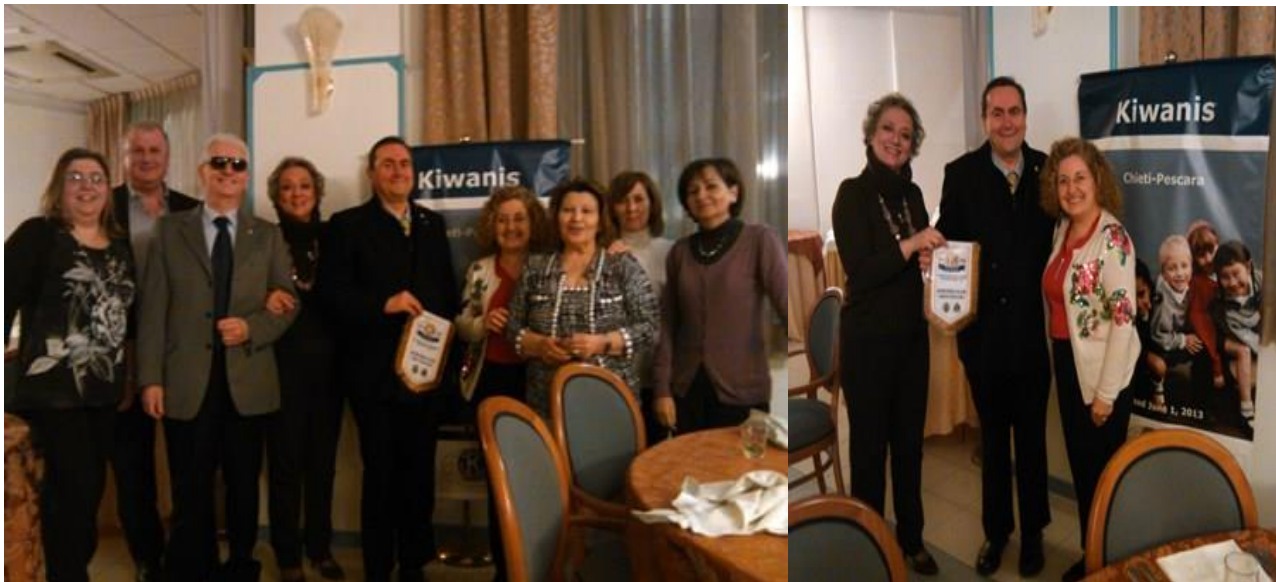
Foto di gruppo col nuovo socio

Nell'occasione il Presidente ha presentato agli ospiti il Kiwanis International, parlando dei suoi services di solidarietà e di informazione culturale, sia a livello internazionale che nazionale e locale.