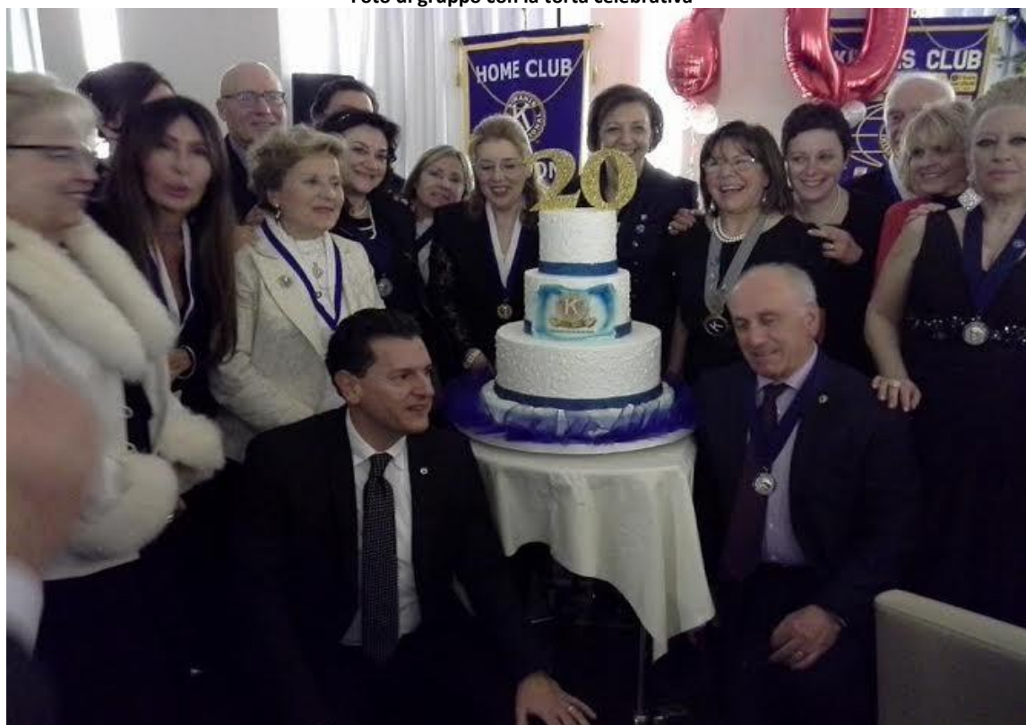
Foto di gruppo con la torta celebrativa