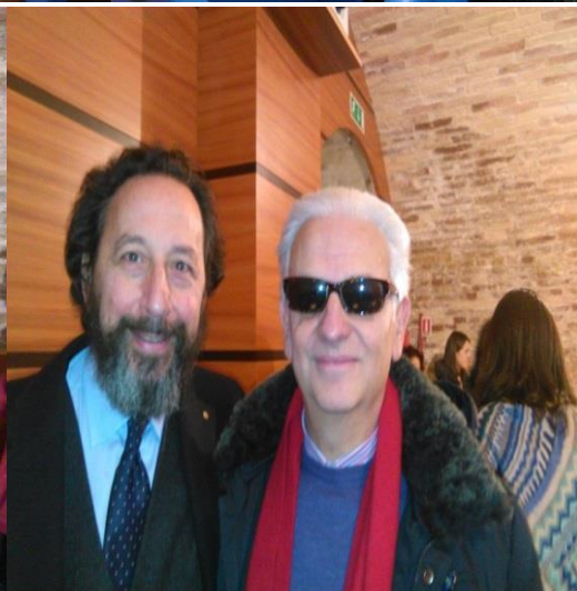
Ulteriori immagini dei partecipanti