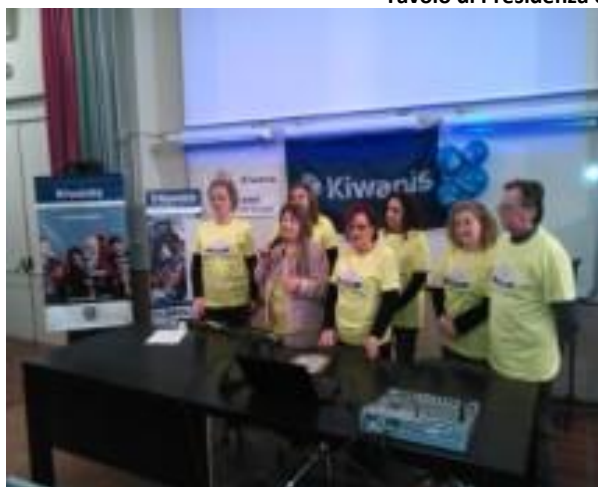
Tavolo di Presidenza ed Aula Magna con partecipanti

Le immagini proiettate, così drammaticamente crude e reali, hanno suscitato nei ragazzi tanto interesse, senso di solidarietà e grande commozione.