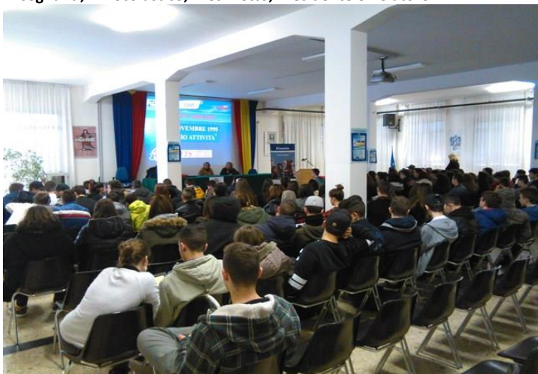
Aula magna gremita