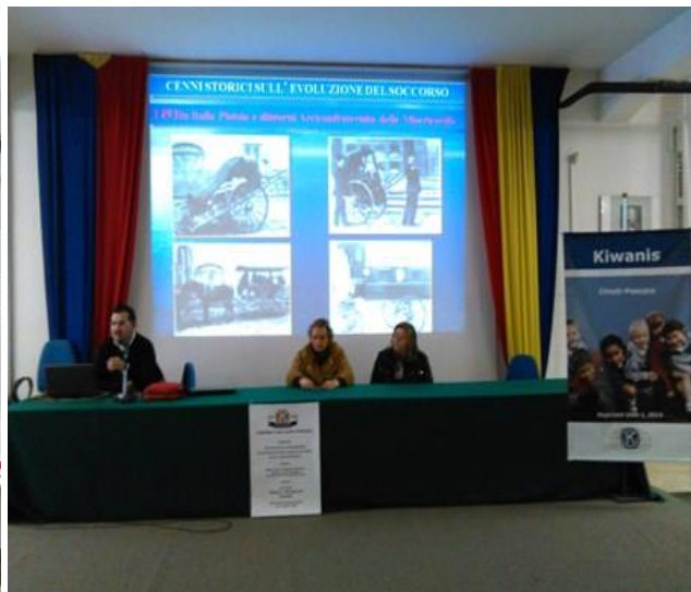
Un momento della relazione