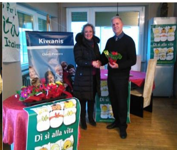
Scambio dei doni tra Presidenti