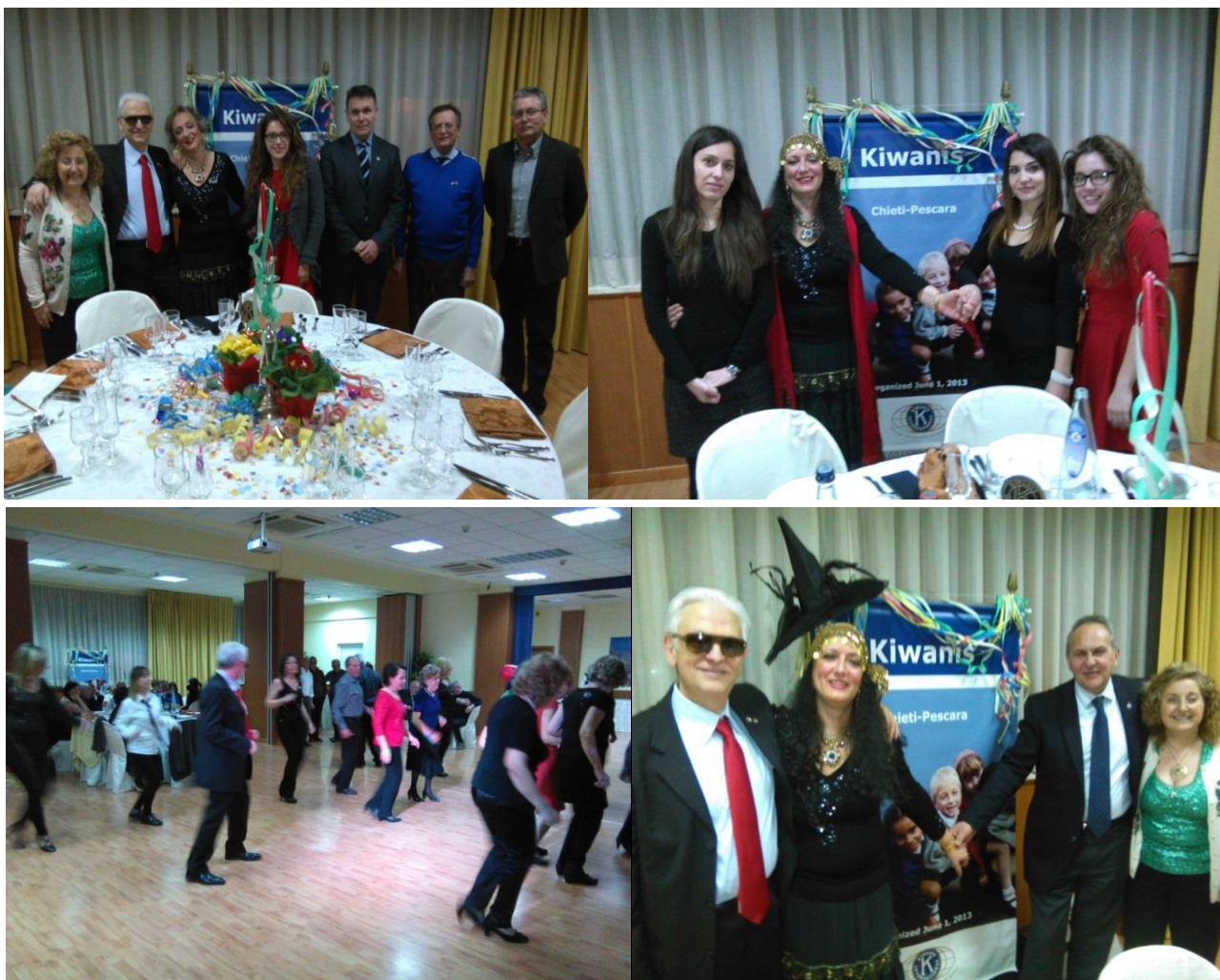
Immagini della serata