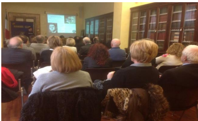
Momento della relazione di Azzarà