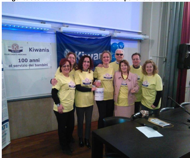
Dirigente Scolastico con Presidente e Componenti del Club