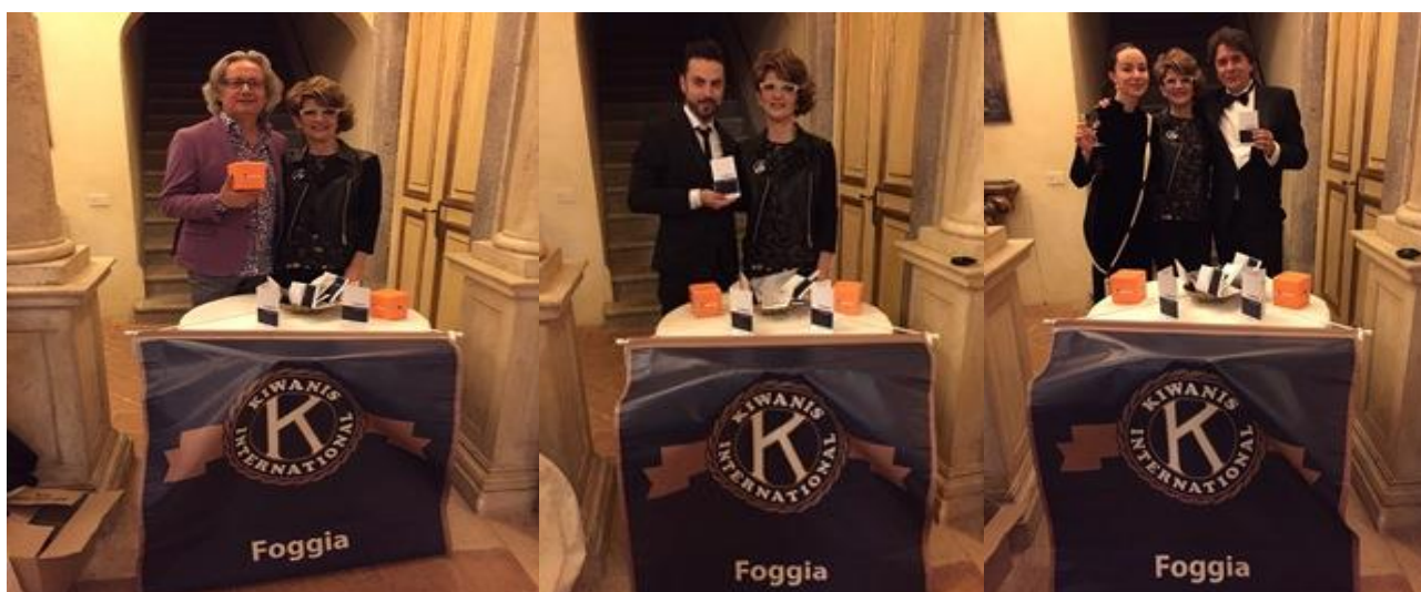
Immagini del corner allestito dal club