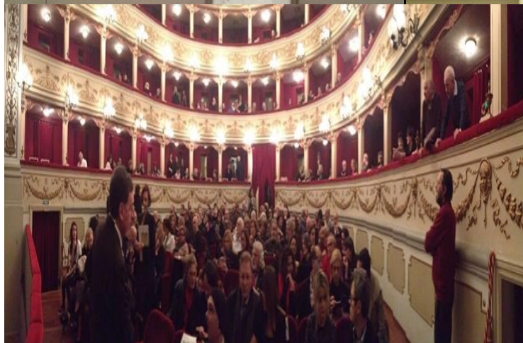
Immagine del teatro affollato