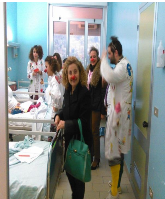
In visita ai reparti