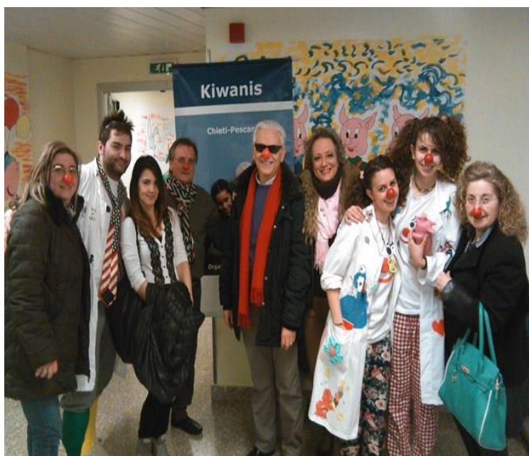
Foto di gruppo con la Compagnia del sorriso

Anche i genitori dei bambini sono stati molto contenti di vederci e di conoscere il Kiwanis International, apprezzando le sue importanti finalità umanitarie.