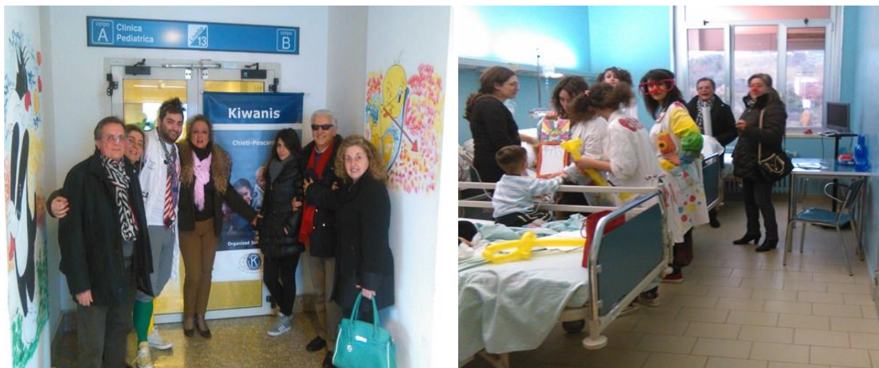
Immagini della giornata