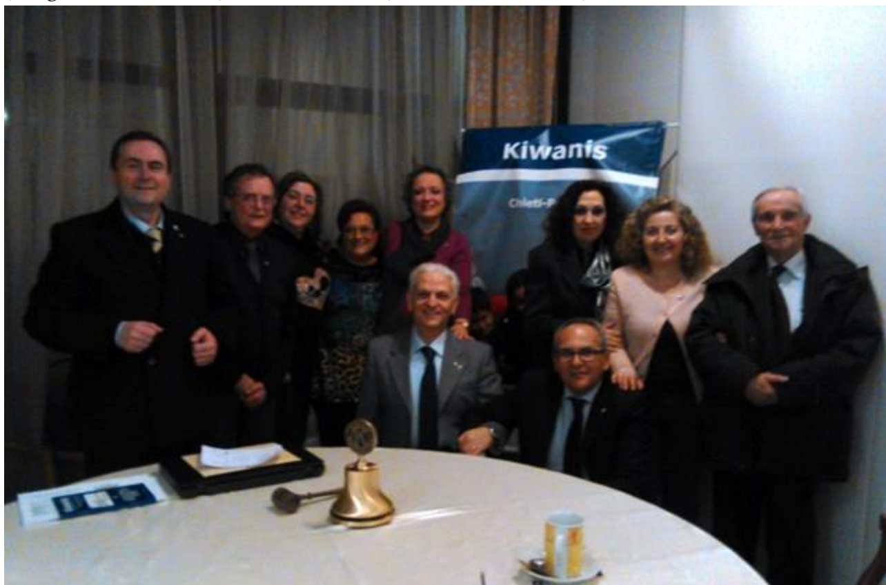
Foto di gruppo al termine dell'Assemblea