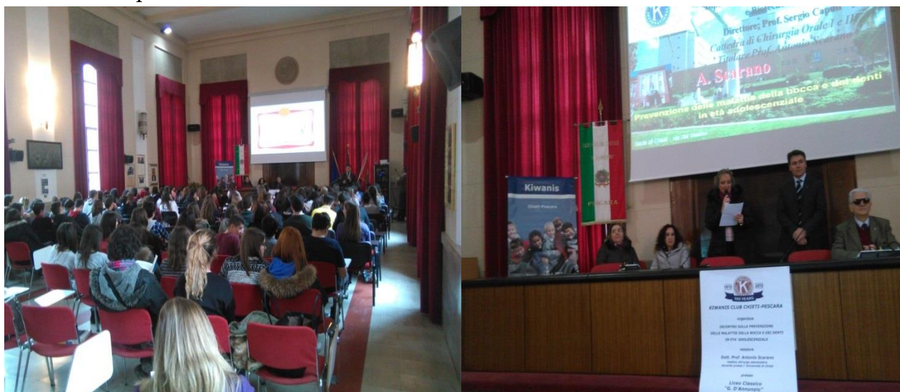
Aula magna gremita

Il Dirigente scolastico ed il corpo docente si sono congratulati per la preziosa e competente informazione medico-scientifica prestata, esprimendo profonda gratitudine al club Chieti-Pescara e auspicando il rinnovarsi di una futura collaborazione.