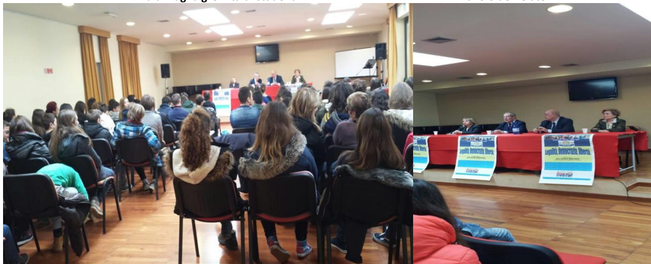
Tavolo dei relatori