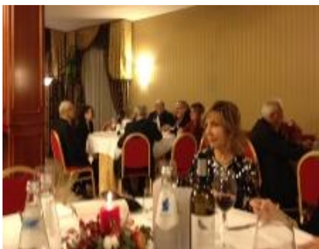
Panoramica della sala