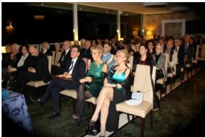
Platea degli intervenuti