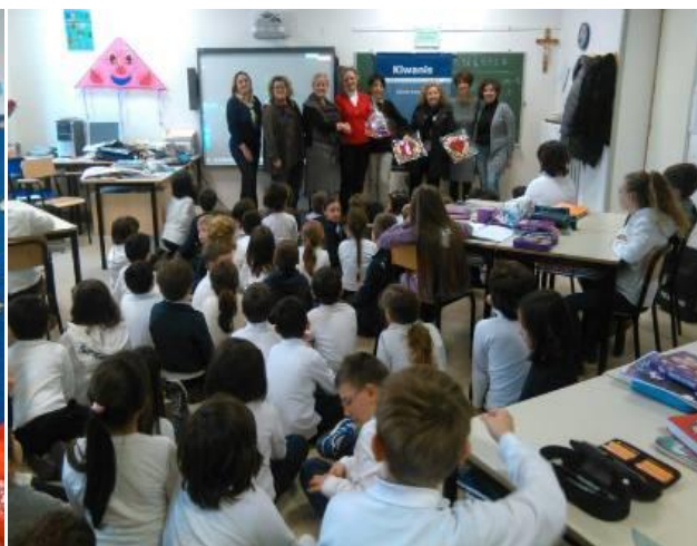
Partecipazione degli alunni