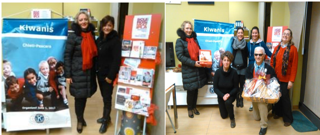
A sin.: i 2 Presidenti. A dx.: foto di gruppo con i doni acquistati

Nell’occasione, anche i volontari della sede sociale dell’AISM di Pescara hanno conosciuto ed apprezzato il Kiwanis International ed i suoi nobili scopi. Questo evento ha fornito ulteriore visibilità alla nostra associazione tant’è che gli stessi volontari AISM si sono congratulati per la sensibilità ed operosità verso i problemi dell’infanzia meno fortunata.