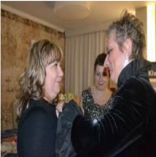
Emozionante momento di investitura del nuovo socio