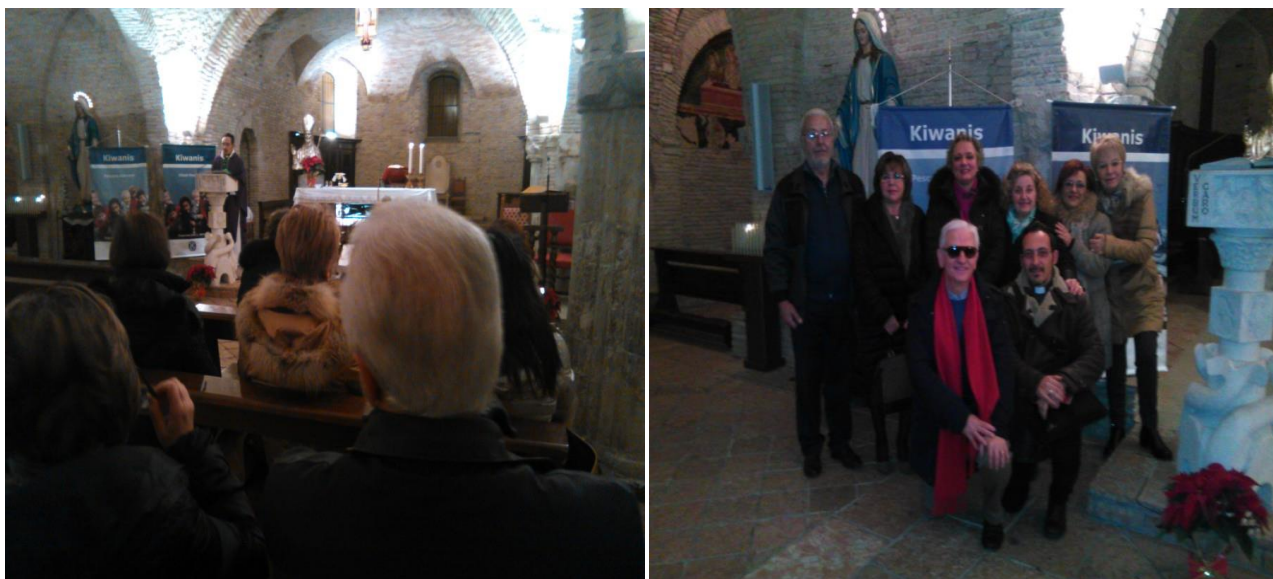
Foto dei partecipanti