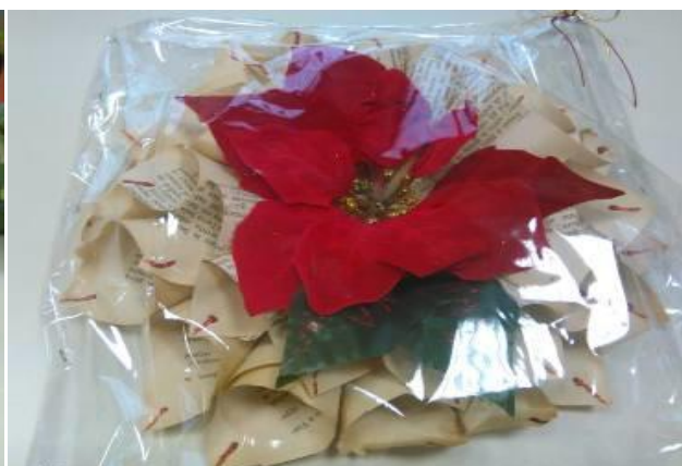
Gli splendidi doni confezionati dagli alunni per la festa di Natale del Club