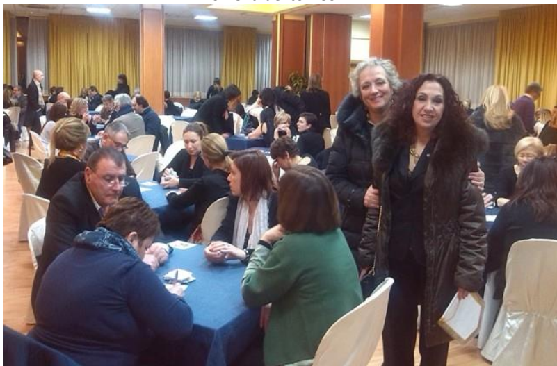
Momenti del torneo