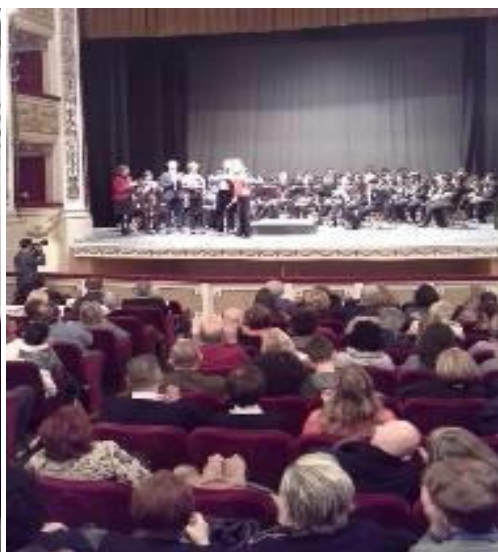
Platea con Orchestra