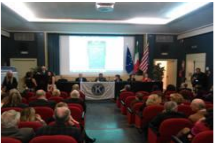
Banner spiegati e sala gremita