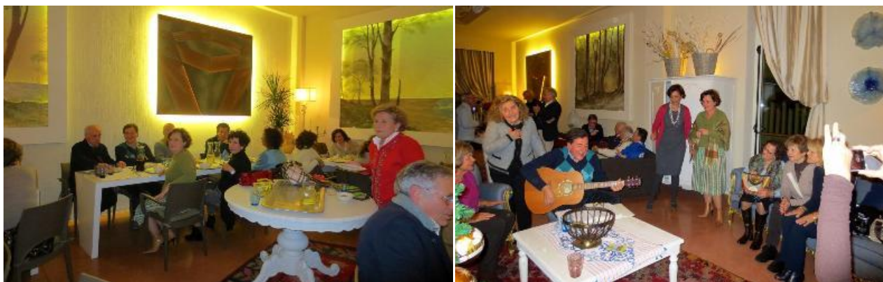
Scene dal caminetto