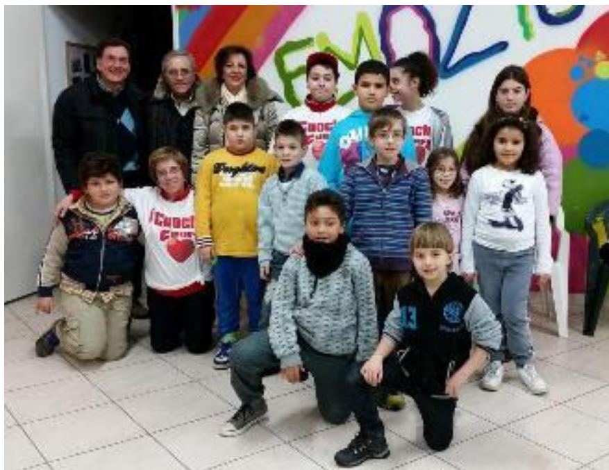
Con i bambini delle famiglie assistite