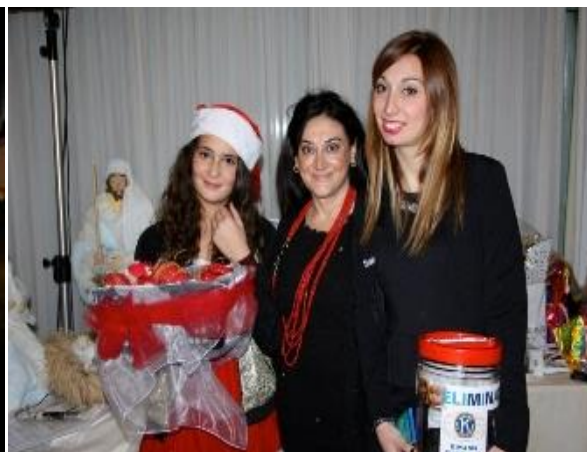
Consegna dei doni