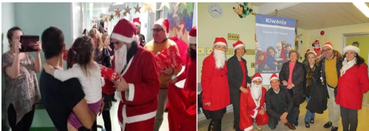
Splendide scene dell'evento