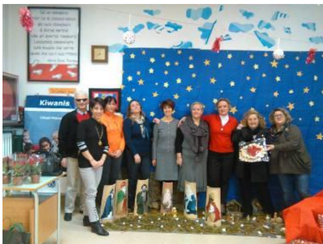
Foto di gruppo con Presidente, soci e insegnanti

Il corpo docente si è congratulato per i nobili scopi di cui il Kiwanis International si occupa, auspicando il prosieguo della collaborazione ed il KC Chieti-Pescara si è impegnato a proporre alla dirigente scolastica interessanti iniziative di formazione culturale infantile.