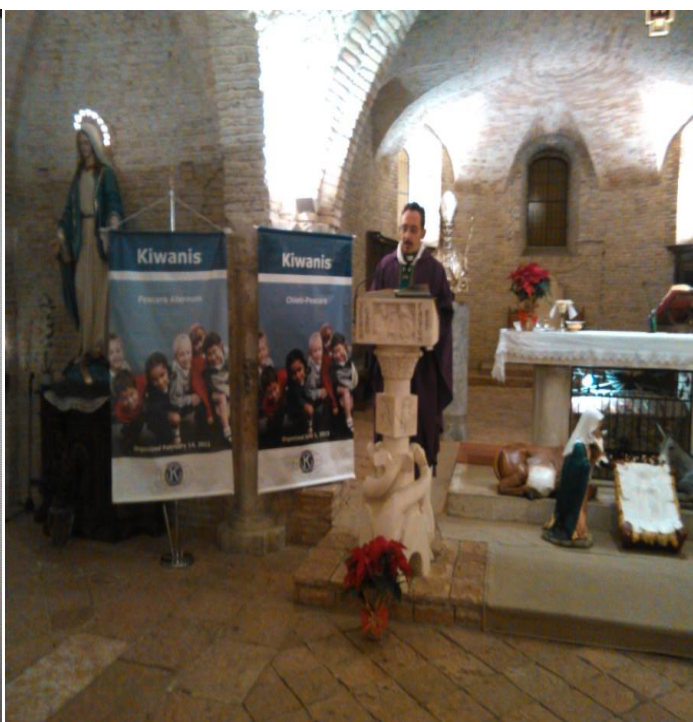
Momento della celebrazione con i banner sull'altare