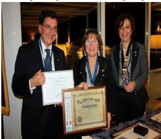
Premiazione Presidential Zeller

Non è mancata la raccolta fondi per Eliminate con una lotteria che ha dimostrato, una volta di più, la generosità di tutti gli ospiti.