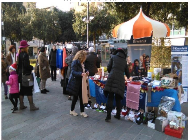
Allestimento dello stand