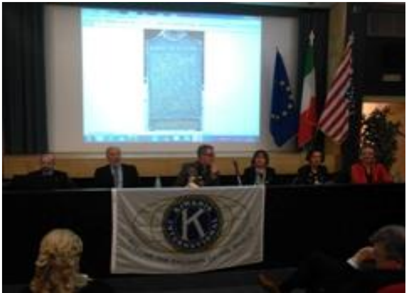
Tavolo Presidenza e immagine Stele Commemorativa di Detroit