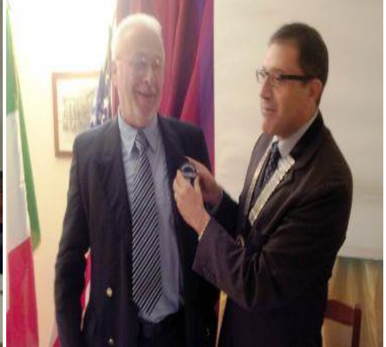
Presidente KC Sponsor Pescara Aternum Coletti