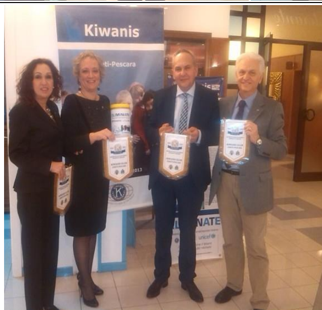
Da sin.: nuova socia, Presidente, Relatore e Pres. Eletto