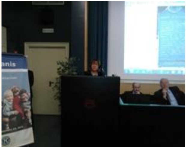
Intervento del Lgt.Governatore