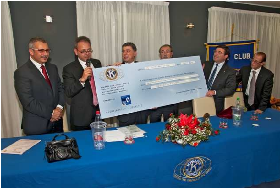
Hotel Sant'Alfio Lentini: Auguri di Natale

Il Lgt Governatore ha altresì presenziato la conviviale degli auguri di Natale del club di Lentini , giorno 13 dicembre presso l'Hotel Sant'Alfio di Lentini, in occasione della quale si è anche celebrata la XXXVI Charter del club e si è promossa un'iniziativa di raccolta fondi (Service a Km 0) equamente divisa tra le Parrocchie dei tre comuni: Lentini, Carlentini e Francofonte.