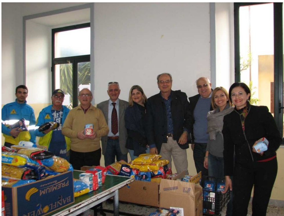
Una delle stanze di smistamento dei prodotti alimentari raccolti, Soci Club Service e Misericordia

Quest'anno, per la prima volta nella storia di Augusta, i Club Service cittadini, vista l'impossibilità dell'Amministrazione Comunale (Commissariata) di allestire gli addobbi natalizi, ed accogliendo una formale richiesta dei Commissari straordinari, hanno deciso di occuparsi in toto della realizzazione di tre alberi di Natale: in pieno centro storico, in borgata ed a Brucoli, interamente a proprie spese.