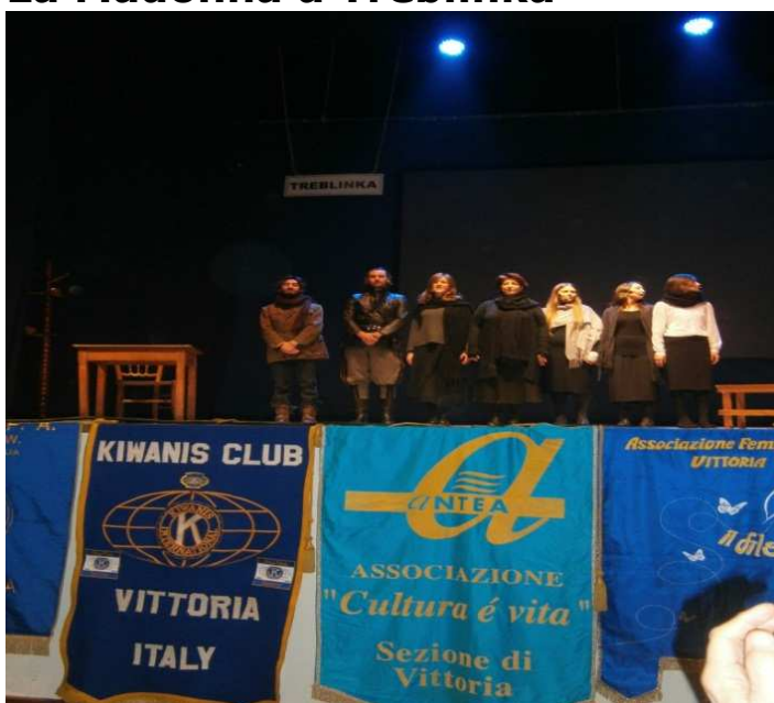
Celebrazione del Giorno della Memoria