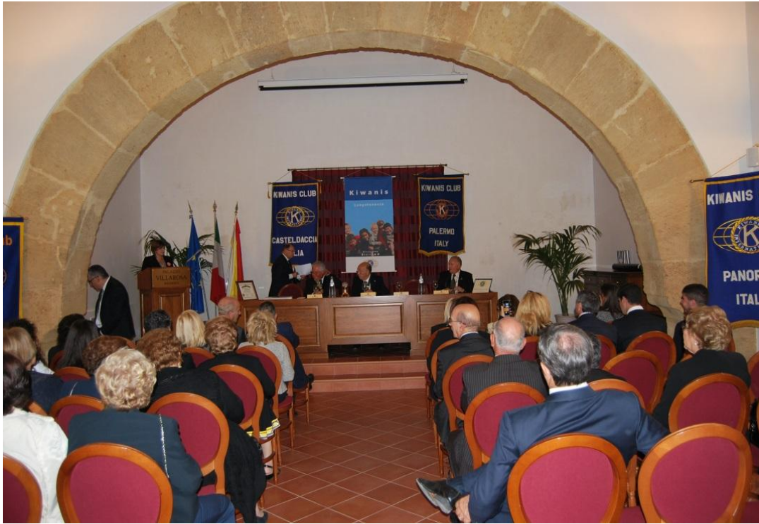
Sala convegni Villarosa