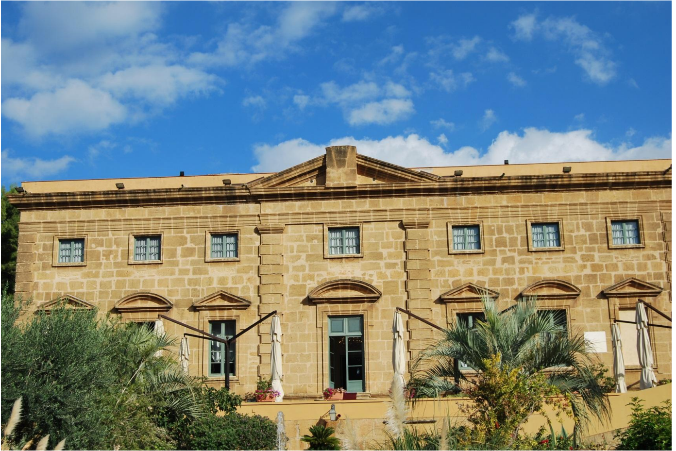
Palazzo Villarosa Bagheria (facciata principale)