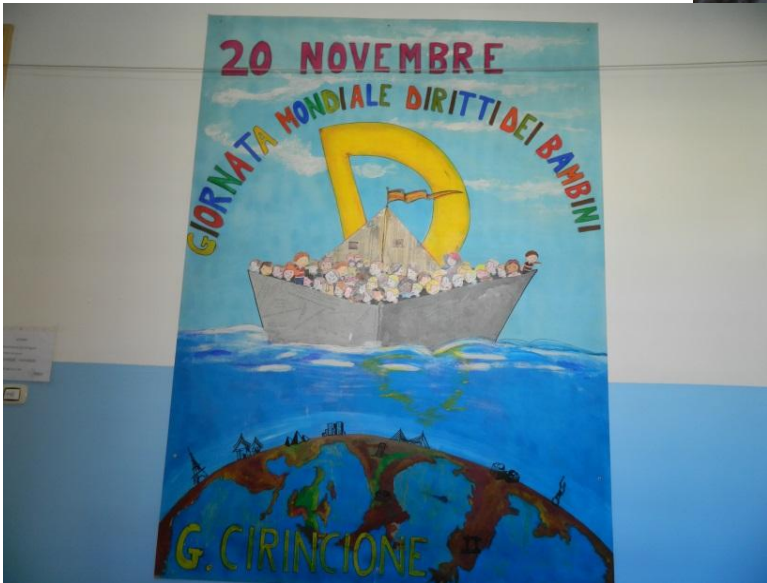
Disegno di un alunno