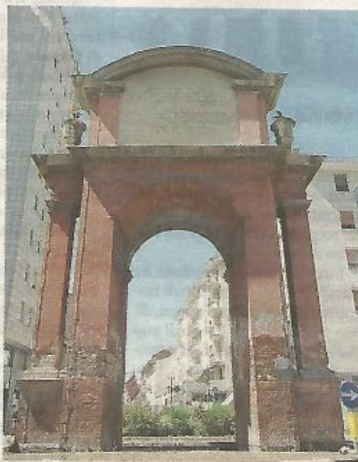
Lo storico arco di piazza Matteotti