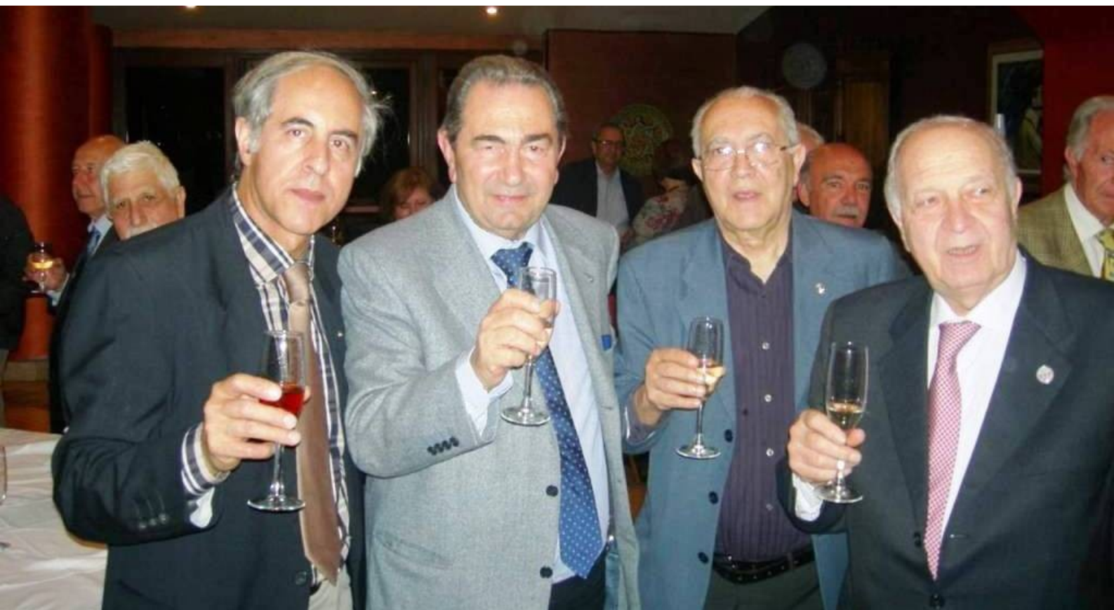
ELEZIONI LGT GOVERNATORI – Ares Hotel S. Giovanni La Punta 15 aprile 2016