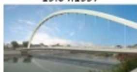
'Ponte Meier sul fiume Tanaro' Alessandria